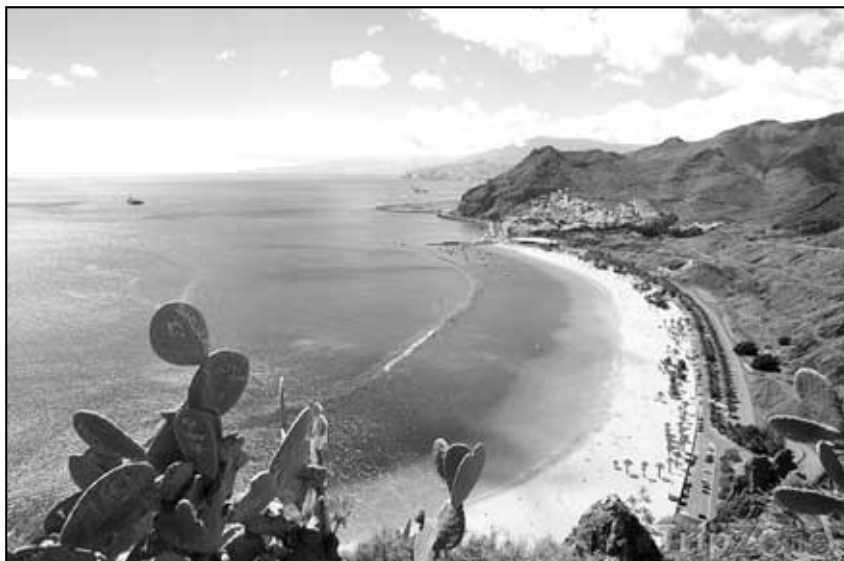
Tenerife, ráj pro létání. - Ilustrační foto.

Po odbavení jsme šli na pivo do transitu, „plzeň“ zde stála 200 korun, tak jsem si dal jen jednu. Ostatní „padáčkáři“ se nějak rozjeli a málem nestihli odlet. Pokračovali i na palubě letadla, kde si koupili Jim Wolker za 800 korun, tak jsem se taky zapojil... Když jsem se probudil po šesti hodinách letu, uviděl jsem pod námi ostrov krásně obtočen obláčky typu „květák“, což pro nás znamená že je dobrá termika a tudíž nás čekají pěkně přelety.