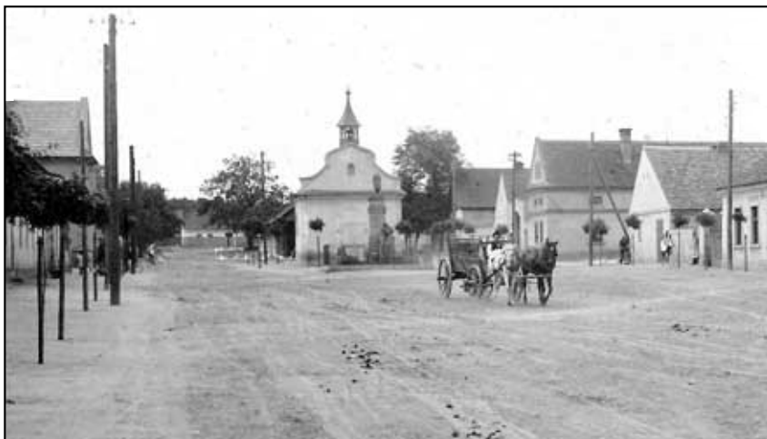
Kaple v roce 1923.