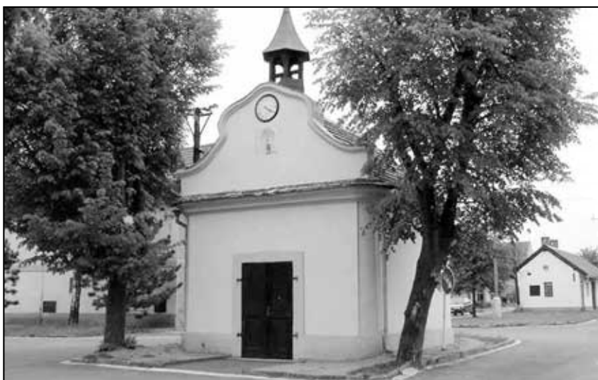
Kaplička v dnešní podobě.