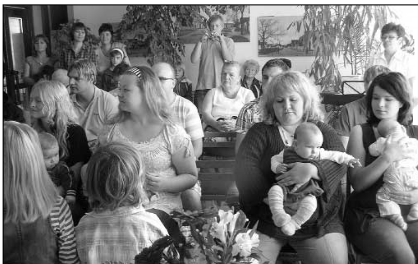
Foto z vítání občáneků dne 1. října 2011.

Přejeme všem šťastný život, a rodičům aby svým děťátkům mohli dát co nejvíce lásky a péče a vše co potřebují ke šťastnému dětství a vychovali z nich čestné a poctivé občany naší země.