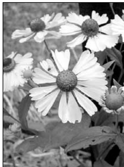
(Údaje poskytnuty k 4. 10. 2011)