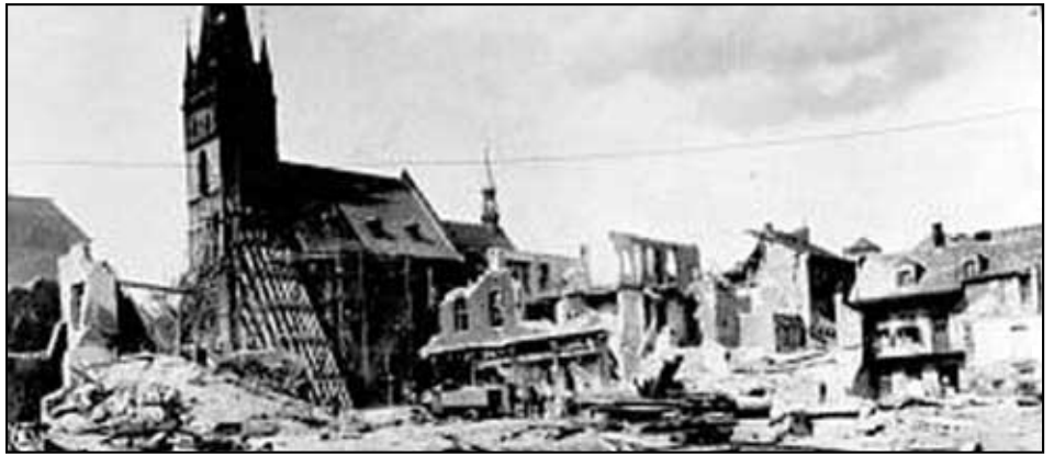
Nálety v Ústí nad Labem.