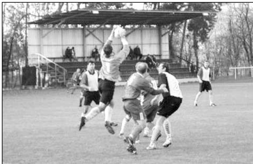
Tvrký boj: Trávčice - Lukavec.

Jak už se stalo u nás v Travčicích tradicí, tak se na konci zimy 5.března