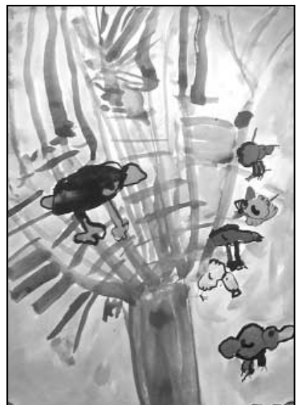
Výtvarné práce starších dětí na téma Ptáčky v zimě.