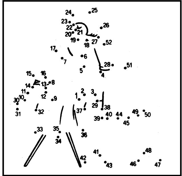
Postupně spojte všechny body podle čísel.