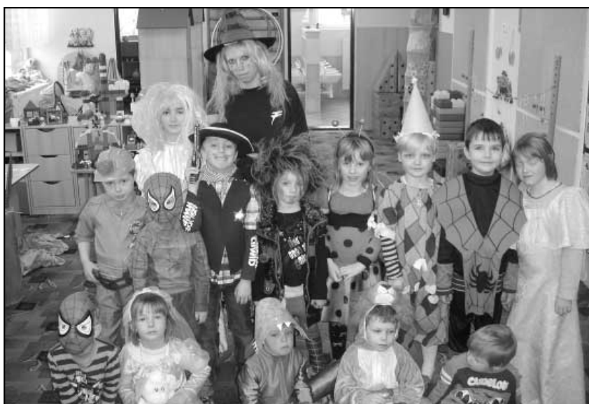
1. hra na školu a její úspěšné děti • 2. Masopustní obchůzky vesnicí • 3. Karneval ve školce.